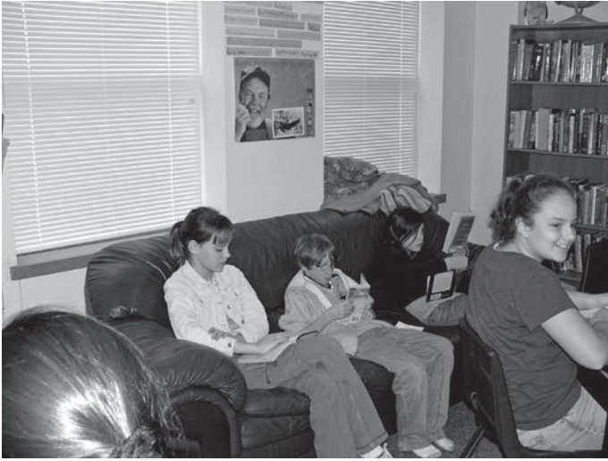
شكل ٣-٢: الطلاب يقرءون وهم جالسون على «العمدة فاني».