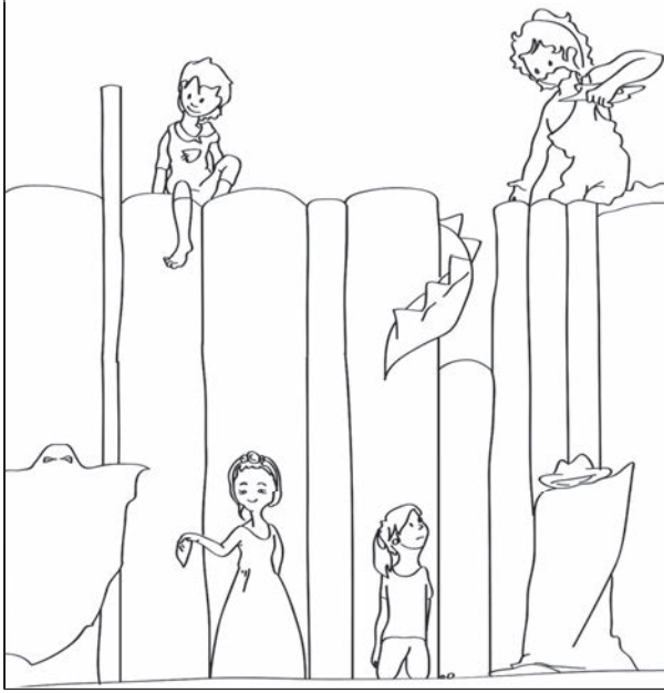
شكل ١: مكتبة فصلنا المدرسي.

في إحدى المرات، جاء ضيف إلى فصلنا، فكدست أنا وطلابي كثيرًا من صناديق الكتب الكرتونية في الخزائن بحجرة الأشغال على الجانب الآخر من الرواق؛ نظرًا لعدم وجود أي مساحة فارغة أسفل طاولة الكمبيوتر الخاصة بي لهذه الصناديق. شعرت آنذاك بأنني أخبئ الملابس المتسخة من حماتي، فكنت أخشى ألا يفهم الزائر حاجتنا لوجود أكوام من الكتب بجميع أنحاء المكان.