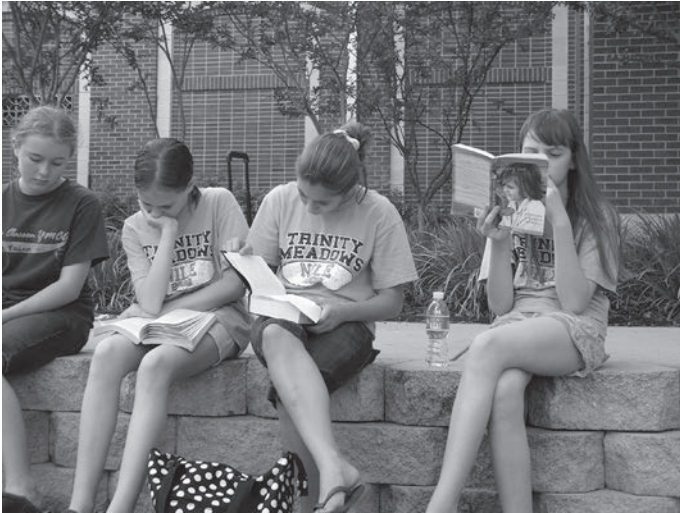
شكل ١-٣: طالبات يقرأن في أثناء انتظارهن وصول حافلة الرحلة الميدانية.

المكتبات! يا إلهي، كم أحبها! تلك الصفوف المترابطة من الكتب القابعة في انتظاري، والكراسي المريحة التي تغريني بالجلوس عليها طويلاً والانغماس في القراءة. تقدّم المكتباتُ المليئةُ بما تسميه فيرجينيا وولف «الكنوز الخفية» ثروةً لأي قارئ. ومن أعظم الأمور التي تشعرني بالسعادة ذهابي للعمل كل يوم في مبنى يضم مكتبة.